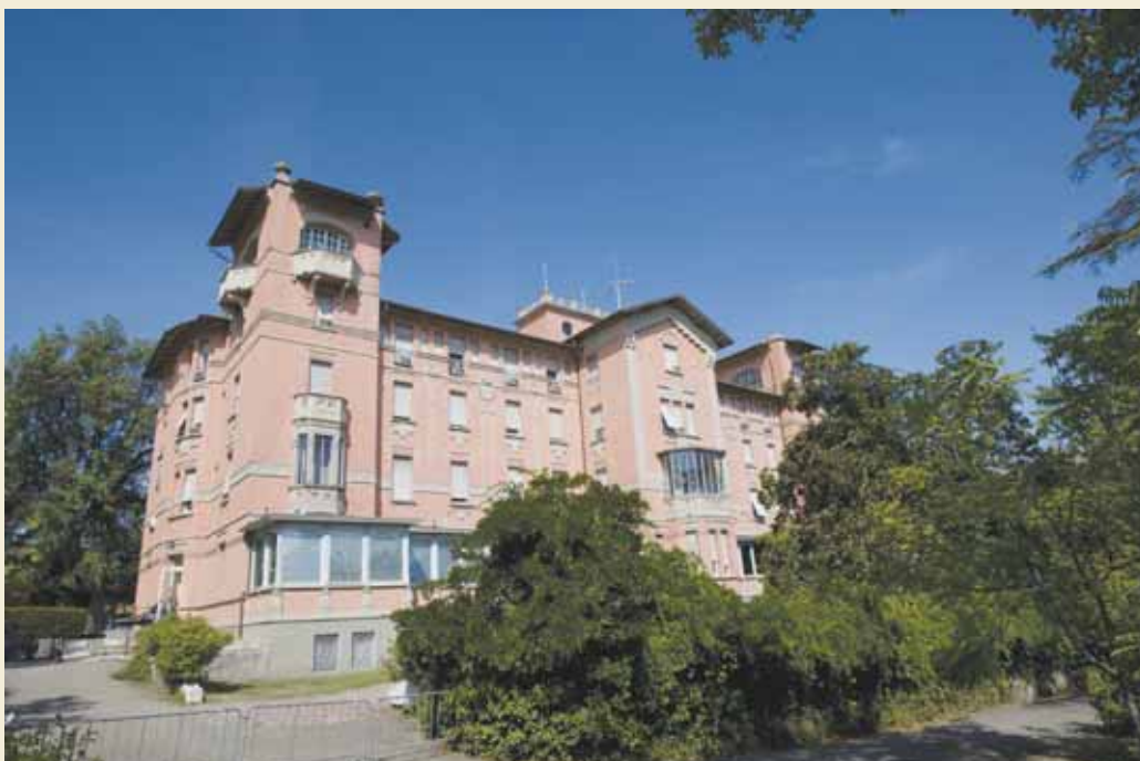
KOPPEL A.W. via Strasburgo, 23/A Parma Tel. 0521 607028 r.a. Fax 0521 607185

N ell'incantevole cornice delle colline parmensi, circondato da 60mila metri quadrati di parco privato, l'elegante edificio di Ramiola Villa di Riposo accoglie i suoi anziani ospiti nel segno della più rassicurante e completa ospitalità. Dai primi anni Ottanta è presente in questa struttura un impianto della ditta Koppel A.W., per il trasporto del personale, ed uno gestito sempre da Koppel adibito invece al movimento lettighe. In un contesto di così grande utilità sociale, e caratterizzato soprattutto da persone non autosufficienti,