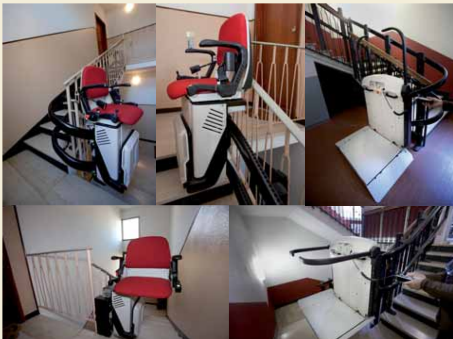
KOPPEL A.W. via Strasburgo, 23/A Parma Tel. 0521 607028 r.a. Fax 0521 607185

L a Koppel A.W. da 54 anni è specializzata nell'installazione di ascensori, e più recentemente si è dedicata anche alla fascia degli home lifts, più propriamente piattaforme elevatrici. In alcuni casi, però, negli edifici non c'è uno spazio sufficiente per poter ospitare apparecchiature di questo ingombro, per quanto ridotto, e, per soddisfare le esigenze di mobilità verticale di anziani o disabili, occorre passare a soluzioni alternative. Una di queste, tra le più pratiche per dislivelli limitati, è l'installazione di un servoscala . Si tratta di un elevatore inclinato che scorre lungo e a fianco di una guida posta a lato delle scale, con ingombro minimo. Quando l'elevatore non è in funzione, viene ripiegato o parcheggiato a lato dell'inizio delle scale, consentendone un uso normale agli abitanti dell'edificio. Questo tipo di dispositivo può coprire una o più rampe di scale. Naturalmente, quando le pendenze della scala sono variabili, vi sono curve strette o più curve, l'installazione si fa delicata e complessa, e richiede un nostro attento studio. Normalmente esistono due tipi di servoscala. Il primo è costituito da una vera e propria poltroncina su cui la persona anziana o parzialmente disabile può sedersi alla base delle scale, per poi rialzarsi una volta raggiunto il piano desiderato. L'altro è invece costituito da una pedana reclinabile o girevole che, quando